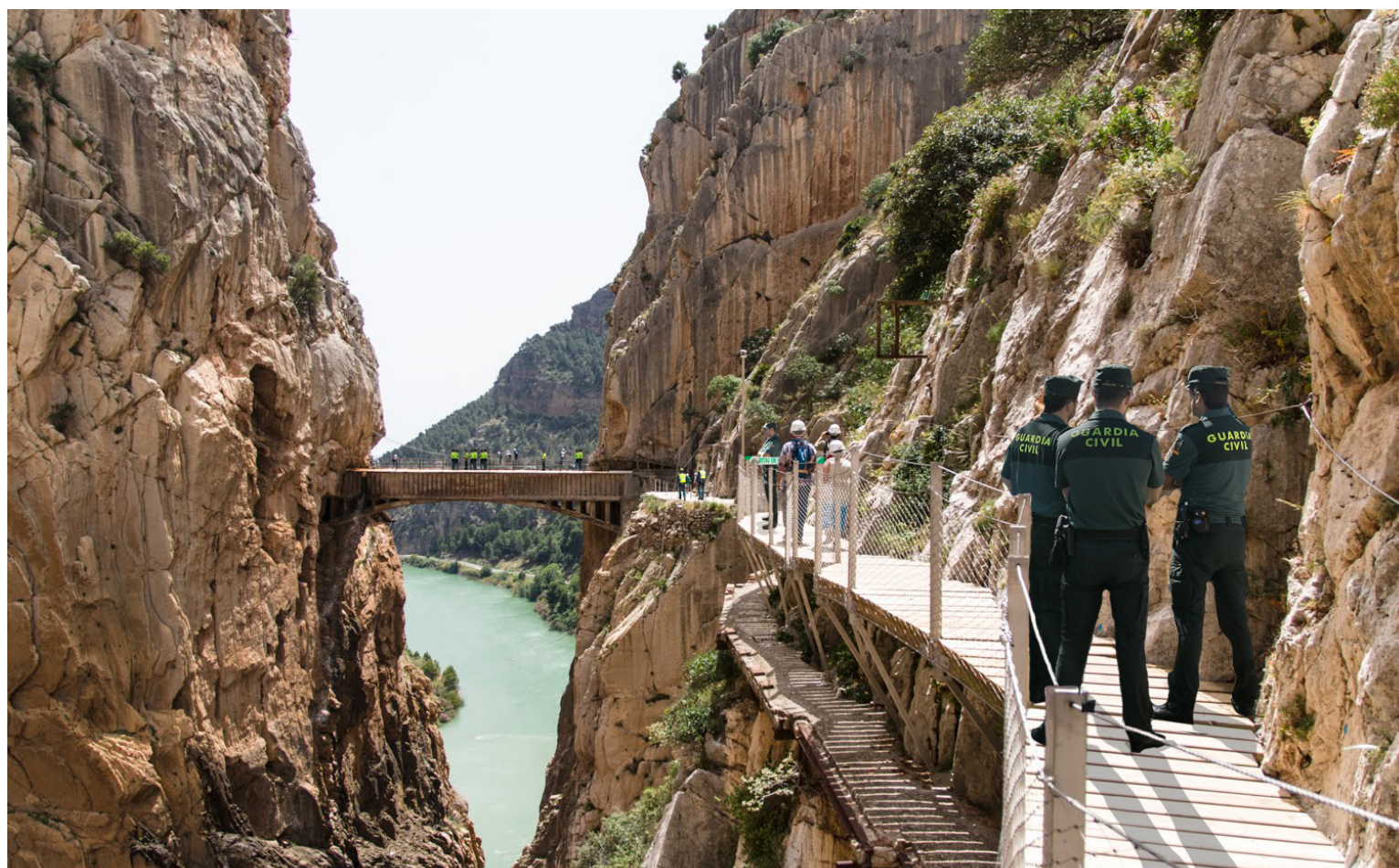
El Caminito del Rey permanecerá cerrado de manera indefinida debido a la investigación policial. A.C.