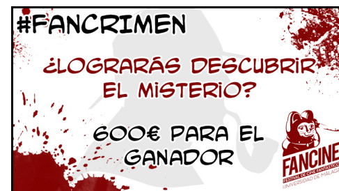
Imagen promocional de la campaña. J.S.